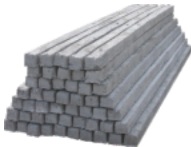
Кол бетонов, 250x10x10 см